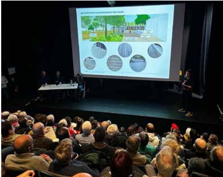
Réunion publique du 15 février 2024

La CAPI (Communauté d'Agglomération Porte de l'Isère) s'associe à ce projet d'aménagement et engagera rapidement les travaux de réfection des réseaux enfouis.