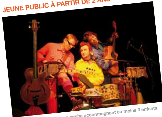
Spectacle gratuit pour un adulte accompagnant au moins 3 enfants.

Ne vous étonnez pas si vous vous mettez à chanter ou à taper dans vos mains en même temps que vos enfants, c'est l'effet Papas rigolos.