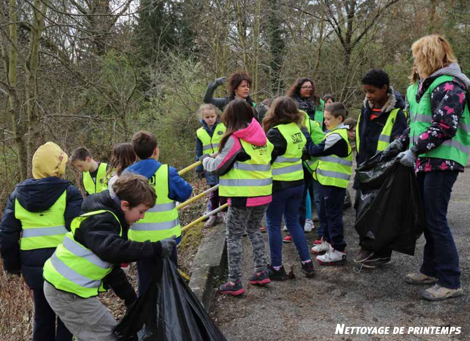
NETTOYAGE DE PRINTEMPS

Le journal d'information de la ville de Saint-Quentin-Fallavier