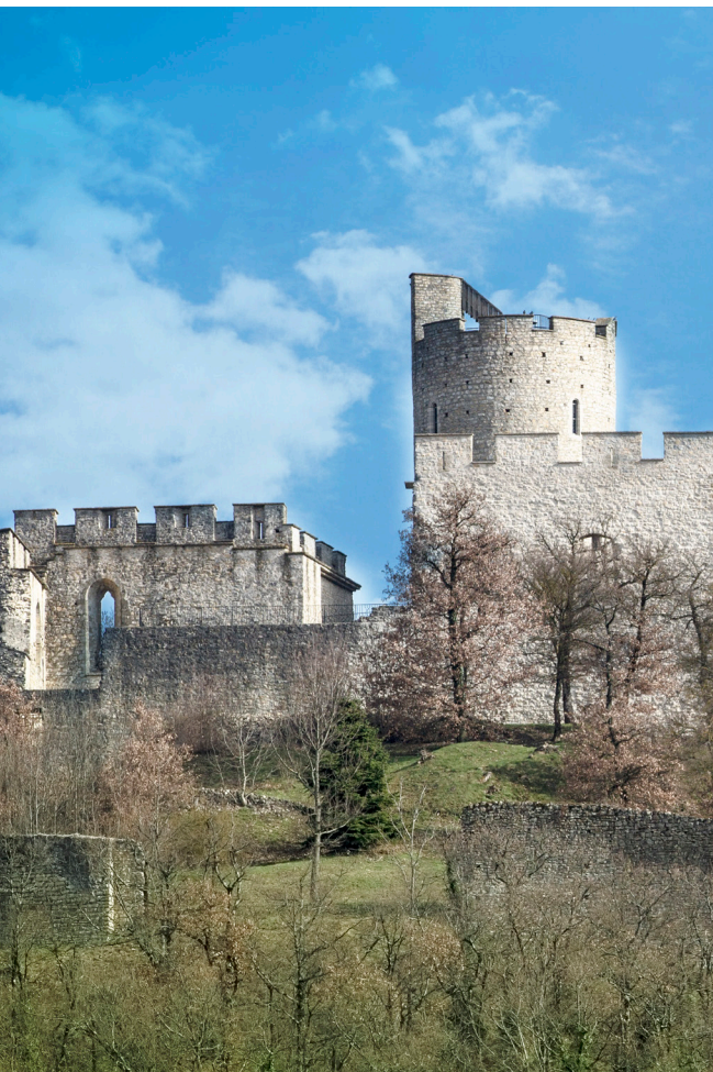
Château fort du XIII ème