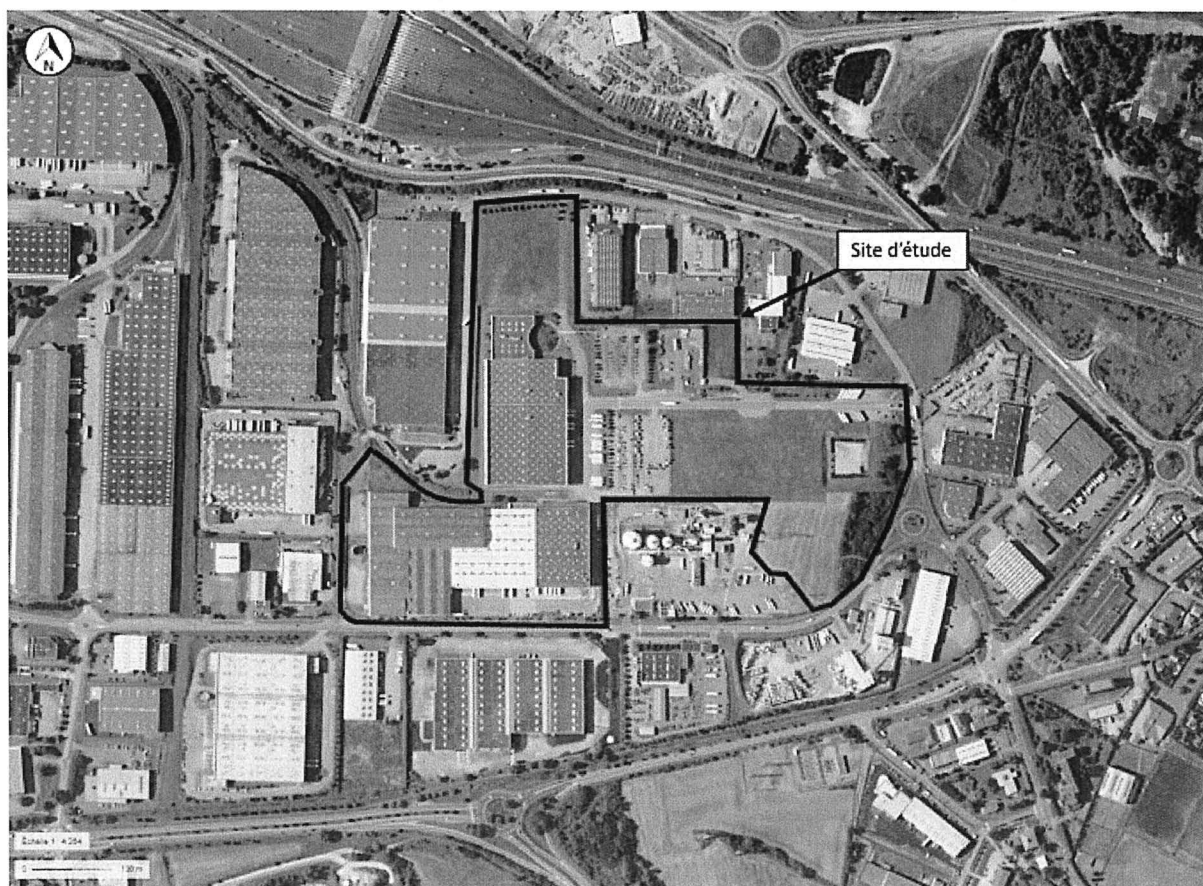
Vue aérienne de la localisation générale de la zone du projet