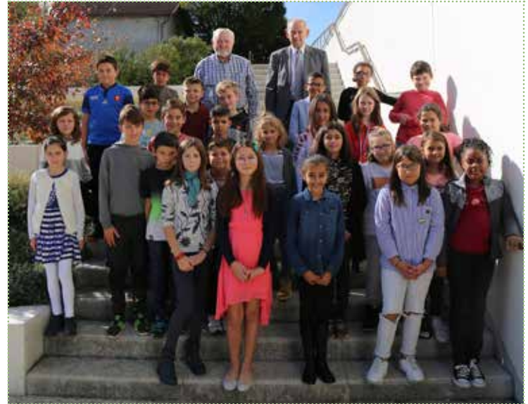
CONSEIL MUNICIPAL D'ENFANTS 2019-2021

Ils mettent en œuvre des projets qui leur tiennent à cœur et qui concernent tous les habitants.