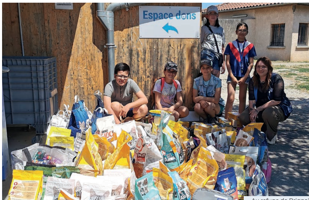
Au refuge de Brignais

Après la visite des locaux, les jeunes ont passé un moment avec les petits pensionnaires. Une belle récompense pour cette action solidaire.