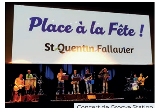
Concert de Groove Station

Ce n'est pas tout ! Un événement arrivera au printemps prochain, réservez vos 24 et 25 mai 2024 pour vivre une immersion dans l'univers des années 80.