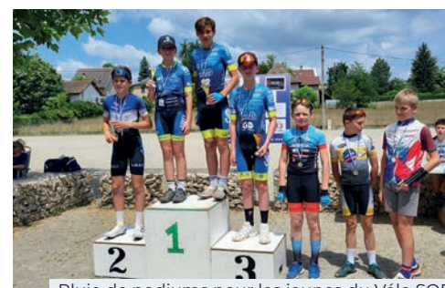
Pluie de podiums pour les jeunes du Vélo SQF

Saint-Quentin-Fallavier, Terre de jeux 2024