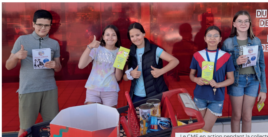
Le CME en action pendant la collecte

P our la première fois, la commission Solidarité du CME a organisé une collecte alimentaire pour nos amis à quatre pattes samedi 24 juin matin devant le Carrefour Market des Mugnets.