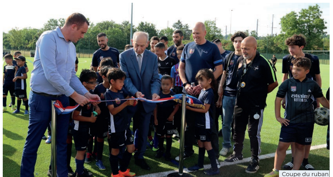
Coupe du ruban

Pour clore cette journée, le foot féminin a été mis à l'honneur avec des matchs de gala des équipes jeunes.