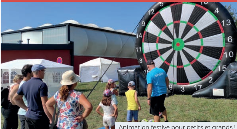
Animation festive pour petits et grands !

La Ville, en collaboration avec les associations st-quentinoises, organise St-Quentin en Fête ! dimanche 3 septembre de 10h à 16h, au complexe sportif de Tharabie.