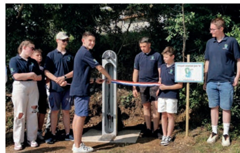
Inauguration de la station vélo du jardin de Ville

Pneu dégonflé, frein desserré, vous avez désormais tous les outils à disposition pour réparer votre vélo gratuitement.