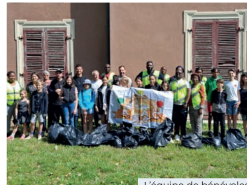
L'équipe de bénévoles

cette opération citoyenne s'adresse aux familles et aux jeunes, les citoyens de demain. Cette année l'association st-quentinoise Les Amis du Congo (Alac) a participé pour la première fois. L'objectif est de faire prendre conscience que chacun est acteur au quotidien de son environnement et de sa qualité de vie et qu'un peu de civisme facilite le vivre ensemble.