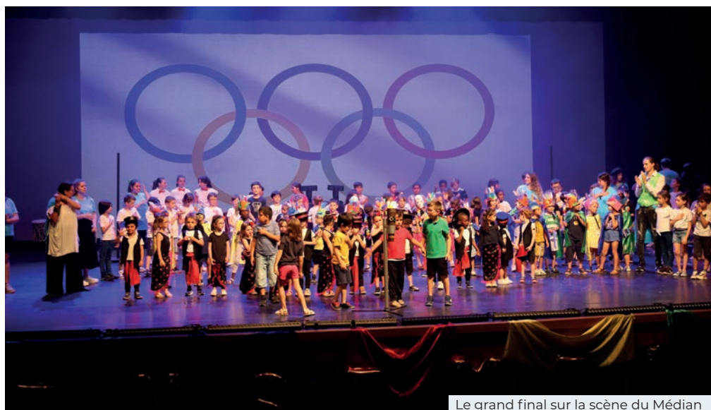
Le grand final sur la scène du Médian

Pour l'occasion, elles avaient réalisées une campagne d'affichage pour rassurer les plus petits qui feront leur rentrée à l'école en septembre et expliquer leur rôle dans le quotidien des enfants scolarisés.