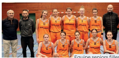
Equipe seniors filles

Une bonne saison pour les seniors Filles qui réussissent l'exploit d'accéder au niveau Pré Région. L'équipe masculine U17 qui a bien progressé malgré les échecs de qualifications en Région puis en D1 et qui perd en finale départementale en D2. Une équipe masculine U15 qui perd également en finale D3.