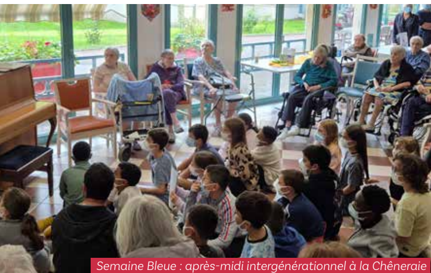
Semaine Bleue : après-midi intergénérationnel à la Chêneraie