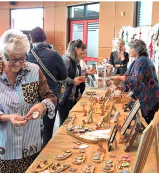
Salon de l'Art de la Récupération et du Fil