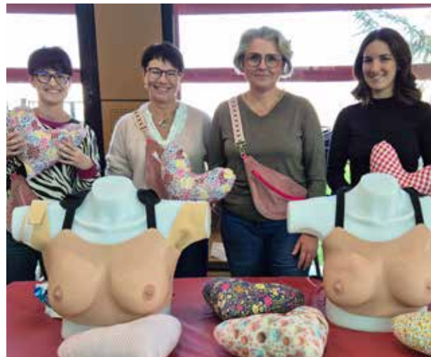
Octobre Rose : marathon "Coussins cœur", la Ville a eu le plaisir d'offrir 65 coussins, 20 bananes, 15 portes gourdes avec la gourde, 20 trousses à médicaments, 35 pochons avec lingettes et 20 poches à redon, faits main, à Hôpital Femme Mère Enfant - HCL