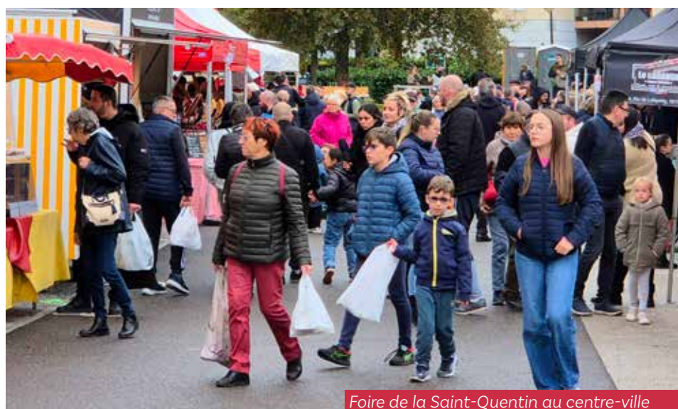
Foire de la Saint-Quentin au centre-ville