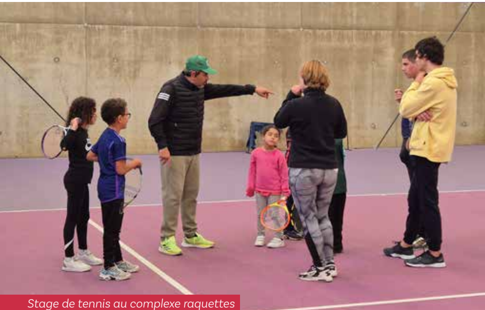
Stage de tennis au complexe raquettes