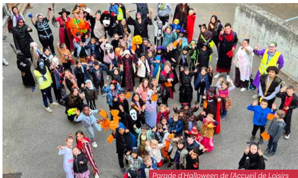
Parade d'Halloween de l'Accueil de Loisirs