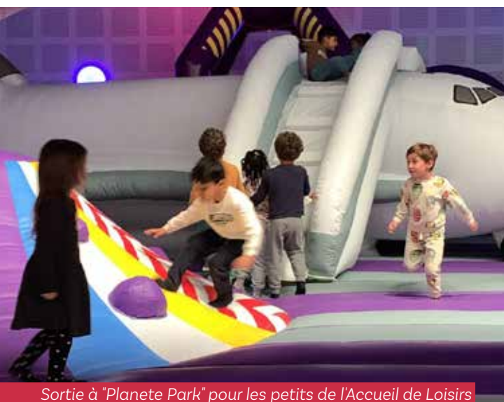
Sortie à "Planete Park" pour les petits de l'Accueil de Loisirs