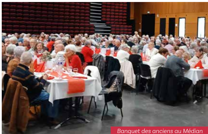
Banquet des anciens au Médian