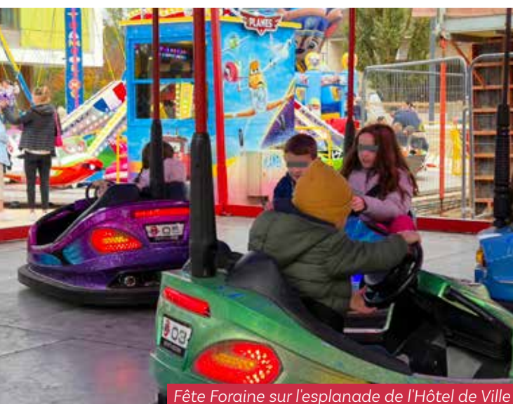
Fête Foraine sur l'esplanade de l'Hôtel de Ville