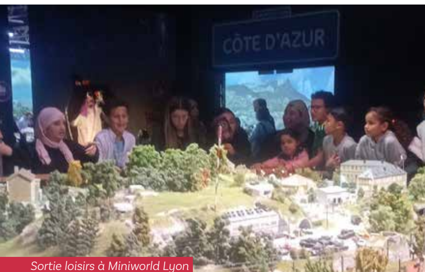
Sortie loisirs à Miniworld Lyon