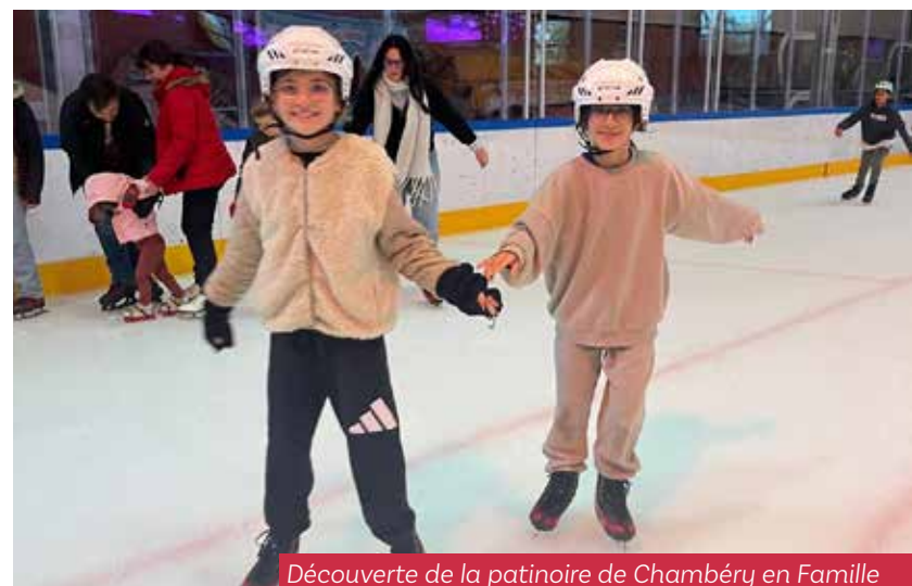
Découverte de la patinoire de Chambéry en Famille