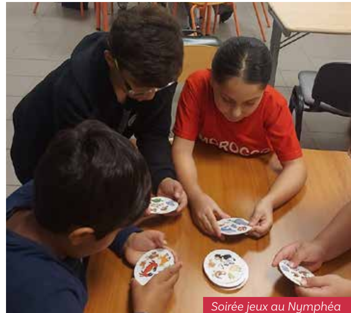
Soirée jeux au Nymphéa