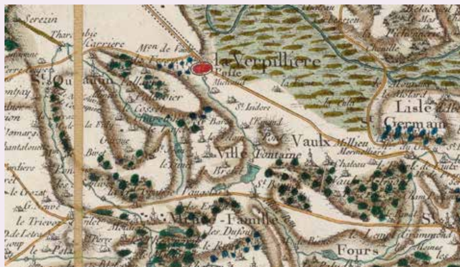
Carte de Cassini ©BnF

constituent un habitat privilégié pour de nombreuses espèces et une halte pour certains oiseaux migrateurs. On peut y observer des espèces protégées, comme le blongios nain ou la tortue cistude, mais aussi des variétés plus communes telles que le canard colvert, la foulque, le crapaud ou encore la carpe.