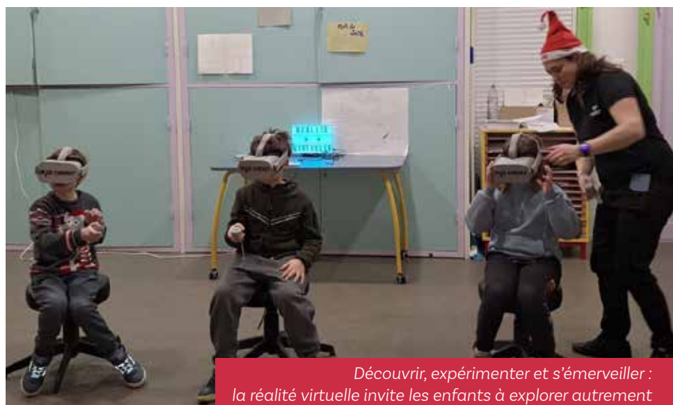
Découvrir, expérimenter et s'émerveiller : la réalité virtuelle invite les enfants à explorer autrement