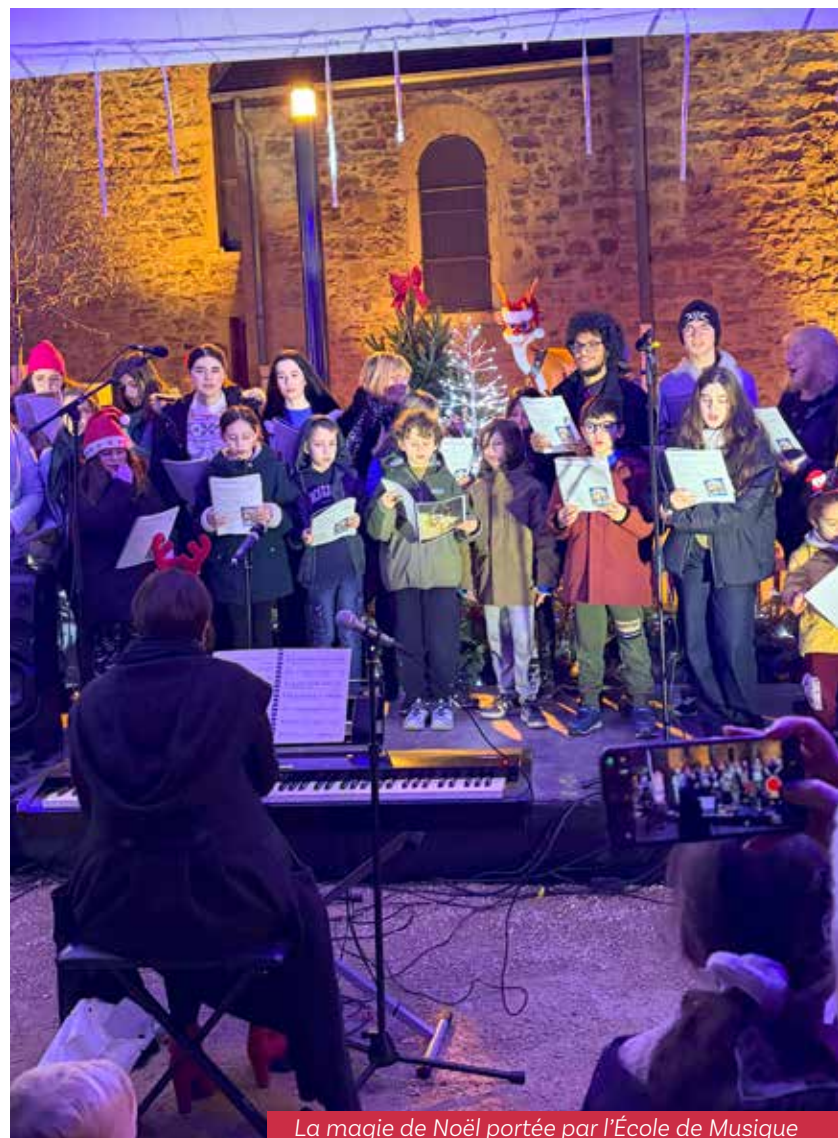
La magie de Noël portée par l'École de Musique