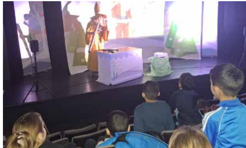
Les enfants de l'accueil de loisirs ont assisté au spectacle Un très heureux Noël