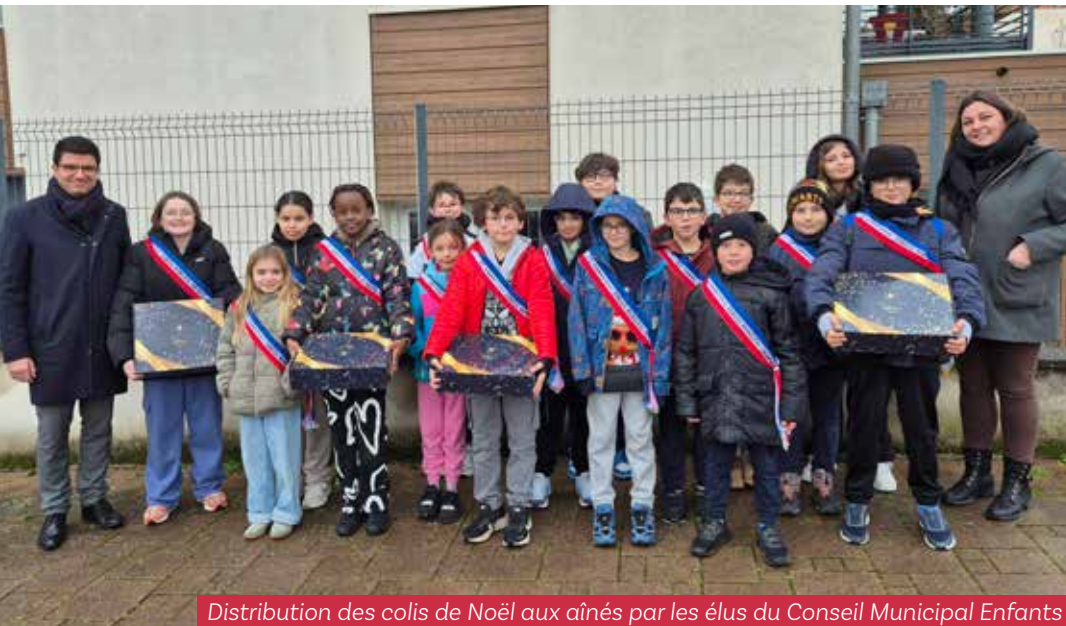
Distribution des colis de Noël aux aînés par les élus du Conseil Municipal Enfants