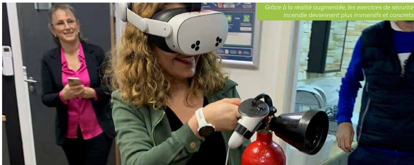
Grâce à la réalité augmentée, les exercices de sécurité incendie deviennent plus immersifs et concrets

À travers cette visite et ce partenariat, la Ville de Saint-Quentin-Fallavier agit en faveur d'une prévention active et innovante, plaçant la sécurité, la santé et le bien-être des agents au cœur de ses priorités. Une démarche essentielle pour garantir un service public de qualité, exercé dans des conditions de travail sûres et responsables.