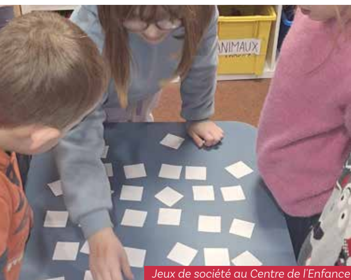
Jeux de société au Centre de l'Enfance