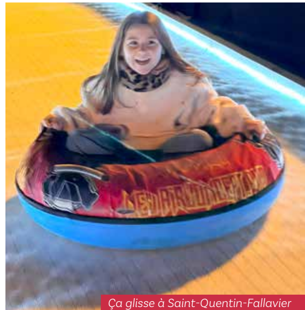
Ça glisse à Saint-Quentin-Fallavier