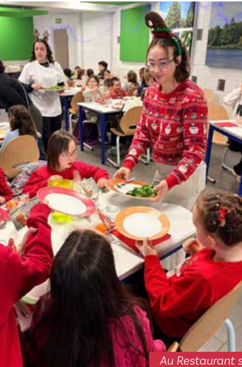
Au Restaurant scolaire, le repas de Noël régale les petits gourmands !