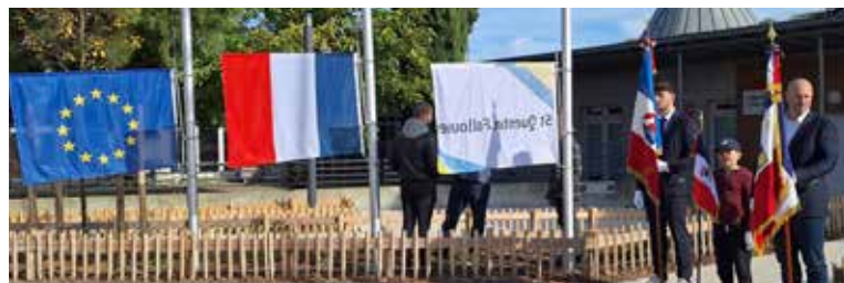
Le 11 novembre 2025, les drapeaux français, européen et communal ont pris place sur l'esplanade de l'Hôtel de Ville

À travers eux, la Ville salue l'action de la FNACA et réaffirme son attachement à la mémoire, à l'engagement et aux valeurs de la République.