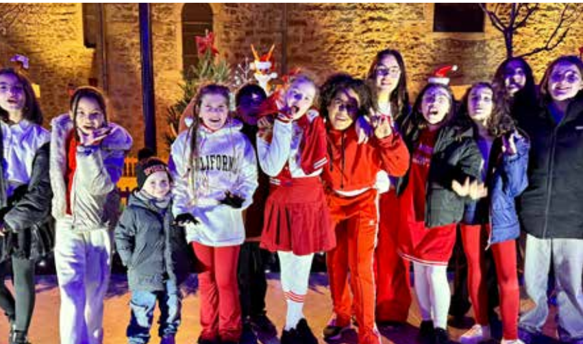
L'atelier de danse urbaine a enflammé le village de Noël le 18 décembre