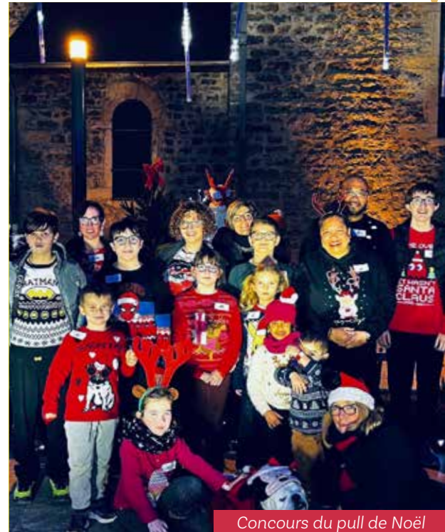
Concours du pull de Noël