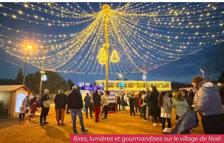
Rires, lumières et gourmandises sur le village de Noël