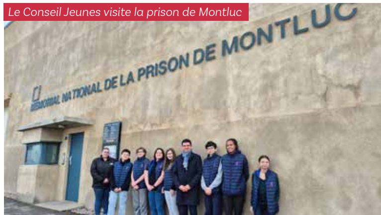
Le Conseil Jeunes visite la prison de Montluc

Dans la continuité de ce travail, le Conseil Jeunes a réalisé en 2024/2025 un nouveau film intitulé « Héritage de Guerre : 80 ans de mémoire ». Présenté le 8 mai 2025 à l'occasion du 80 ème anniversaire de l'Armistice, ce film mêle découvertes historiques et témoignages précieux.