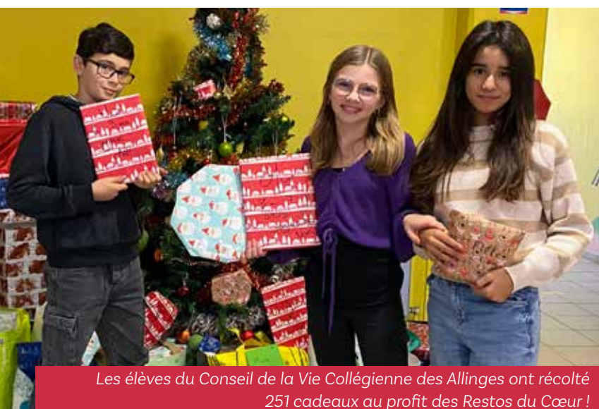
Les élèves du Conseil de la Vie Collégienne des Allinges ont récolté 251 cadeaux au profit des Restos du Cœur !