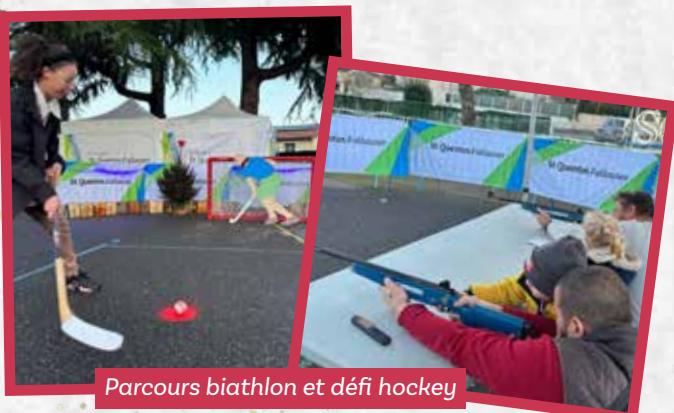
Parcours biathlon et défi hockey