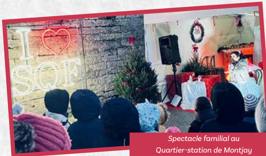
Spectacle familial au Quartier-station de Montjay