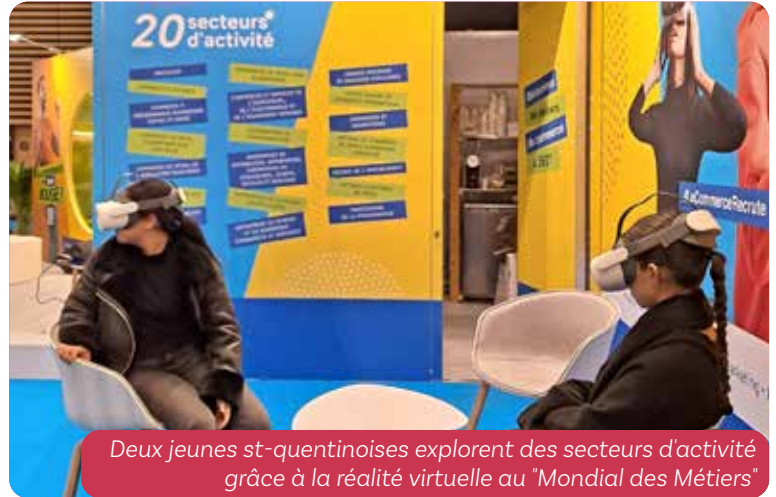
Deux jeunes st-quentinoises explorent des secteurs d'activité grâce à la réalité virtuelle au "Mondial des Métiers"

Grâce à des initiatives locales, des collaborations avec les acteurs éducatifs et économiques, et des actions concrètes, la Ville de Saint-Quentin-Fallavier accompagne les jeunes dans le développement de leur potentiel.