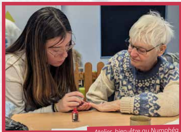
Atelier bien-être au Nymphéa pendant les vacances scolaires