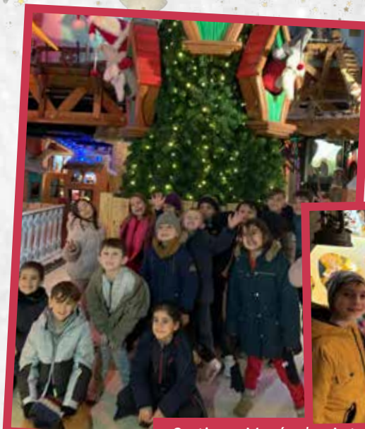
Sortie au Musée des Automates à Lans-en-Vercors