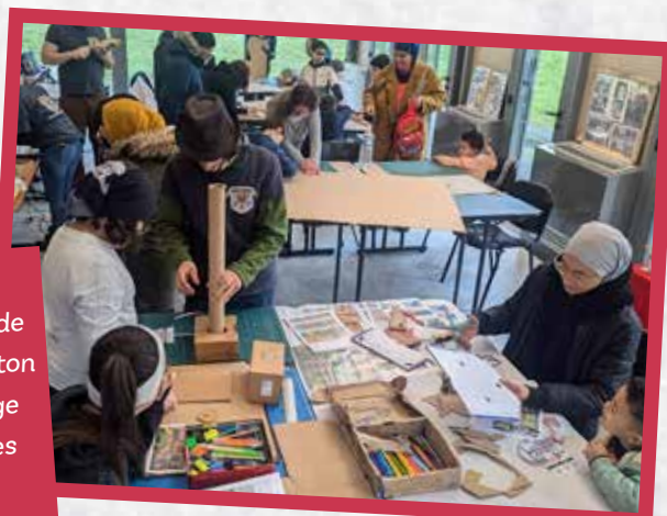
Atelier de fabrication de lutins en carton sur le Village de Noël des Moines