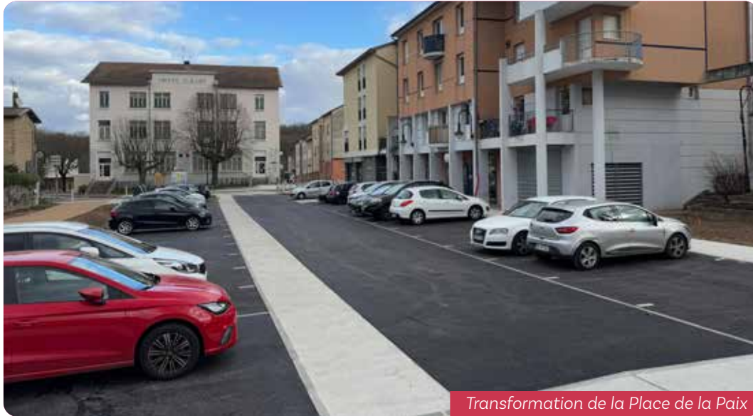
Transformation de la Place de la Paix

Transformer une ville, c'est préparer son avenir.