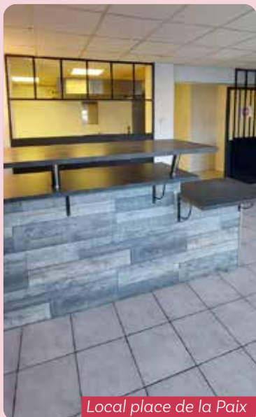
Local place de la Paix