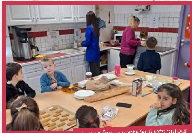
Temps fort parents/enfants autour de la cuisine à l'Accueil de Loisirs