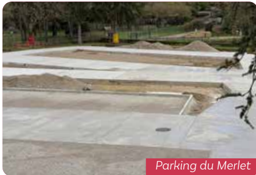
Parking du Merlet

Le parking du Merlet ouvrira partiellement fin janvier et en totalité au printemps. Les plantations, l'éclairage et le déploiement de la vidéo-protections seront fait dans un second temps.