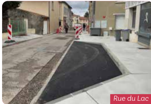
Rue du Lac

La future grande esplanade devant la Mairie et le nouveau bâtiment commercial accueilleront bientôt de nouveaux lieux de vie. Ce projet vise à réenergiser le centre-ville et à recréer une attractivité commerciale durable.