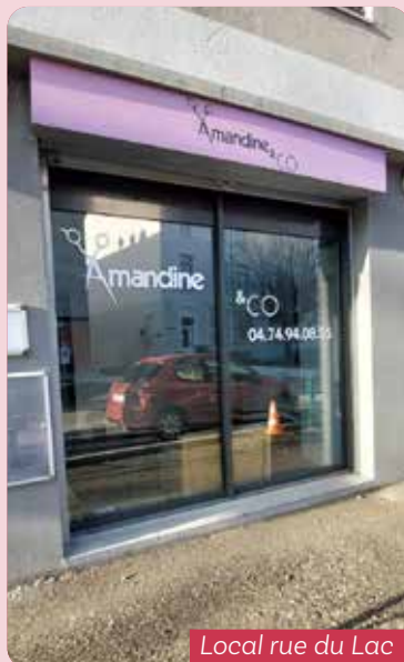
Local rue du Lac

Dans le cadre de sa politique de réaménagement urbain, la Ville a lancé un ambitieux projet de requalification de son centre-ville.