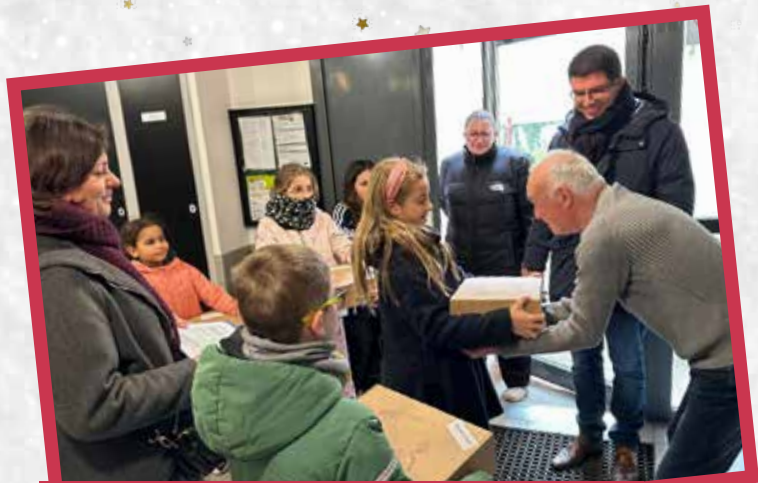
Distribution des colis de Noël aux seniors par les élus du Conseil Municipal et du Conseil Municipal Enfants