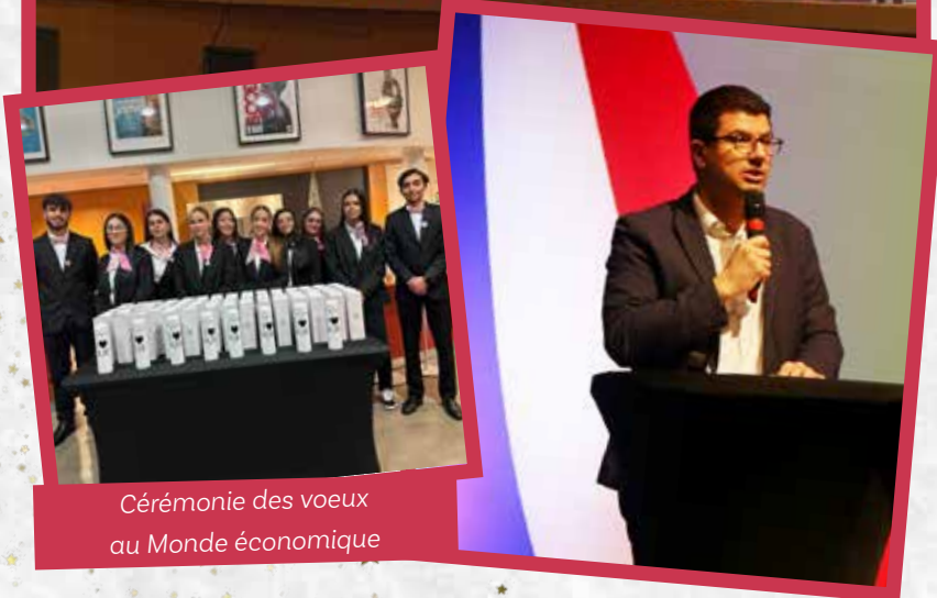
Cérémonie des vœux au Monde économique