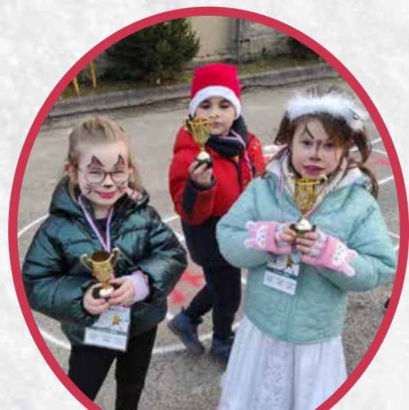
Les champions du Village de Noël : ils ont relevé tous les défis sportifs