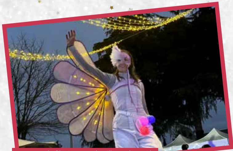
Spectacle féerique sur le village de Noël avec l'échassière du Cirquenfleur