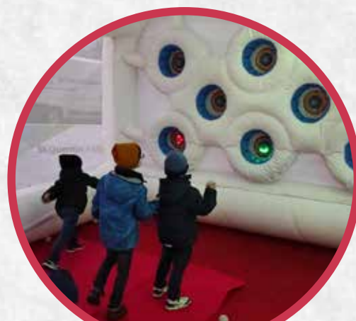
Défis sportifs sur une cible interactive